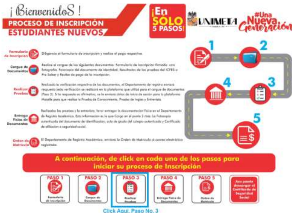
Imagen 1: Como Ingresar al Paso No. 3 del Proceso de inscripción.

Carrera 32 N° 34B-26 Campus San Fernando - Sede -Marachuaque 1 piso PBX: 6621825 Ext.: 119 Villavicencio - Meta - Colombia E-mail: intic@unimeta.edu.co - www.unimeta.edu.co