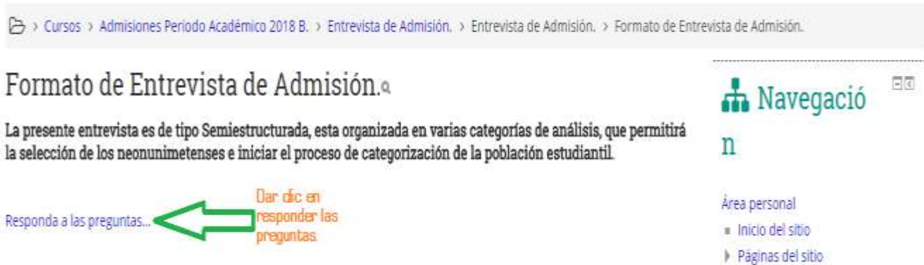
Imagen 7: Responder las preguntas.

6. Para continuar al desarrollo de la entrevista, debemos. (Ver Imagen Nro. 7)